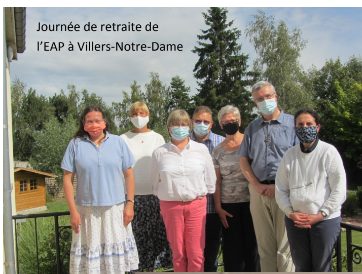
Journée de retraite de l'EAP à Villers-Notre-Dame