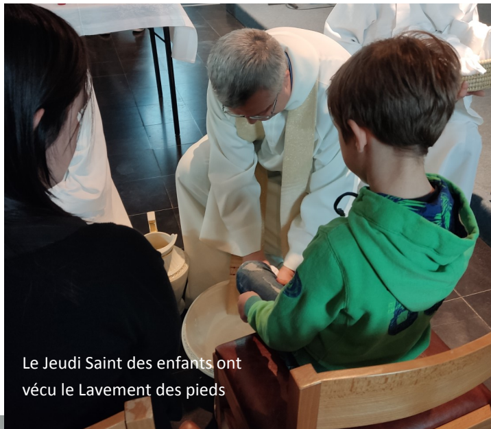
Le Jeudi Saint des enfants ont vécu le Lavement des pieds