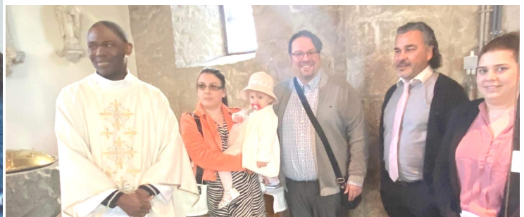
Joie de Pâques en images : 6 enfants ont été baptisés en ces fêtes pascales..

Dans la foi et l'espérance nous avons célébré les funérailles de :