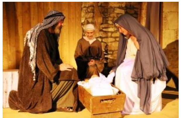
Crèche vivante, diocèse de Vannes

« Dieu, Toi qui nous aimes tant, nous te disons merci ! Merci pour Jésus venu nous dire ton Amour. Merci pour la joie de Noël dans nos maisons et dans nos cœurs. Merci pour la vie, pour les bébés, pour nos familles. Donne à tous les enfants du monde le bonheur d'être aimés, d'être heureux. Aide-nous à dire aux autres tout ce que Tu fais pour nous ! Dieu, Notre Père et Père de tous les hommes, Garde tes enfants rassemblés dans ta bonté. Donne-nous ton Esprit de joie, et fais de nous les témoins de ta tendresse, Toi qui nous aimes pour les siècles des siècles. Amen »